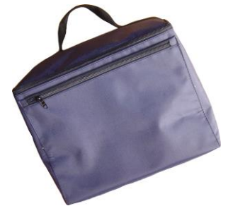
isotérmicas de mano