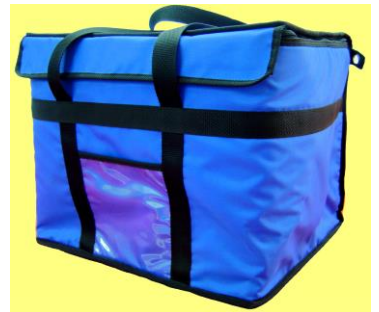
Isotérmicas gran volumen

Fabricados con materiales plásticos de gran resistencia, es posible personalizarlo con el logo de su empresa e incluyen numeraciones secuenciales o códigos de barras sin ningún coste adicional.