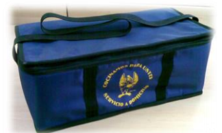
isotérmicas de bandolera